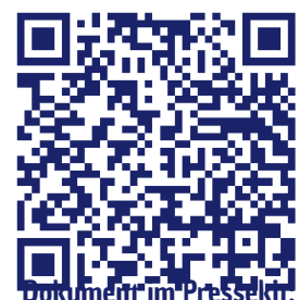
Dokument im Pressekit

Wir empfehlen für lokale Programme schon um 18:30 Uhr mit Grußworten, Zeitzeugen und/oder unsere Hymne Die Hoffnung lebt zuerst zu beginnen. Ab 19 Uhr werden die 10 offiziellen Lieder gemeinsam gesungen: Oh Happy Day, Tage wie diese, Die Gedanken sind frei, Großer Gott, wir loben dich, Freiheit, Hevenu Shalom Alechem, We Shall Overcome, Mensch (Herbert Grönemeyer), Von guten Mächten, Der Mond ist aufgegangen . Den Abend beenden wir schließlich mit einem Medley der Deutschen und der Europahymne .