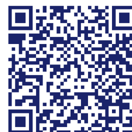
Ordner im Pressekit: Infos zu den Liedern

Wir empfehlen für lokale Programme schon um 18:30 Uhr mit Grußworten, Zeitzegen und/oder unsere Hymne Die Hoffnung lebt zuerst zu beginnen. Ab 19 Uhr werden die 10 offiziellen Lieder gemeinsam gesungen: Lean on me, You raise me up, Aller Augen warten auf dich Herre, Hevenu Shalom Alechem, Froh zu sein bedarf es wenig, Sag mir wo die Blumen sind, Freiheit, We shall overcome, Der Mond ist aufgegangen, Von guten Mächten (wunderbar geborgen) . Zusätzlich gibt es das Themenlied Die Gedanken sind frei zum inhaltlichen Schwerpunkt ‚Meinungsfreiheit‘ in diesem Jahr, wozu wir auch einen nationalen Schreibwettbewerb mit weiteren Partnern starten. Den Abend beenden wir schließlich mit einem Medley der Deutschen und der Europahymne .